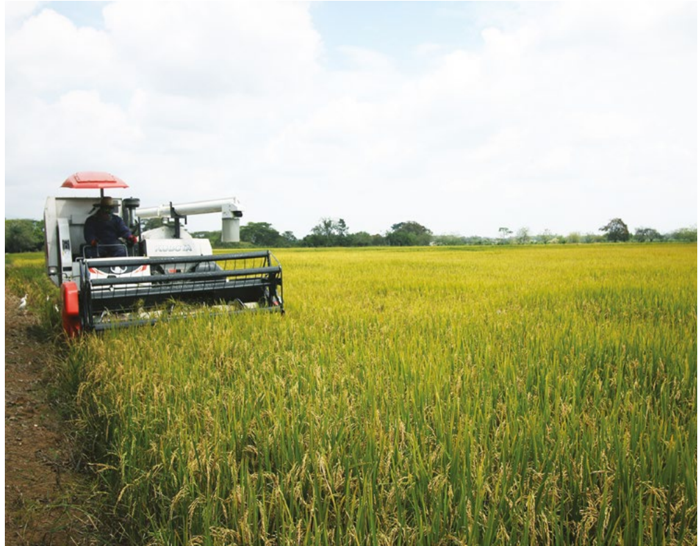
Figura 3. Maquinaria que permite reducir las pérdidas durante la cosecha.