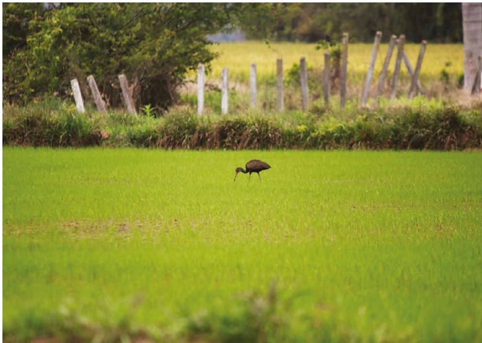
Figura 2. Presencia de gran variedad y número de aves.